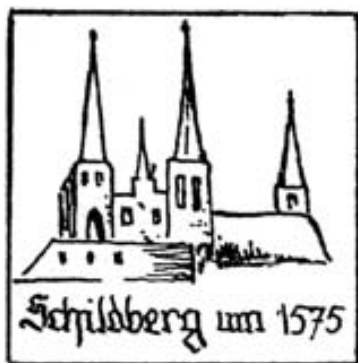
Nejstarší vyobrazení dominanty města z roku 1575, kresba od H. Iternitschky, 1934.

Na místě dnešního chrámu, v těsné blízkosti hradního areálu, však stával kostel o pár století dříve. Nejstarší vyobrazení dominanty města pochází z roku 1575 (tzv. Fabriciova značka, je otázkou, jde-li o vyobrazení kostela či hrádku, ale nejspíš obojího, v tu dobu ještě hrádek stál). Další kresba zobrazuje město roku 1630. Tato vyobrazení jsou značně schematická, o tom, nakolik jsou pravdivá, můžeme jen polemizovat.