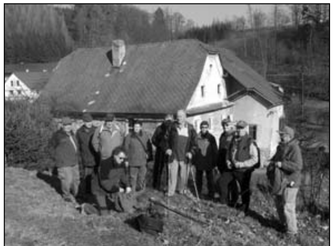
U písařovského mlýna.