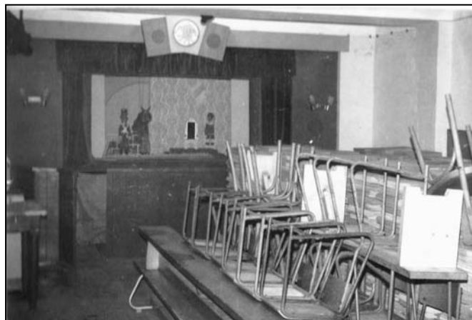
Eternitové tašky v sále divadla (stav z května r. 1979).