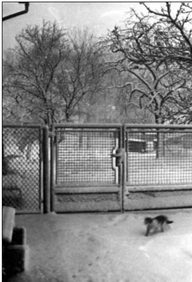
Je 30. dubna 1985, otevírám dveře... a koukám jako jelen.