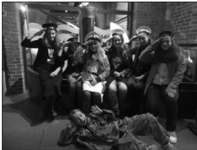
The National museum of the royal navy - Portsmouth

doků. Věž má tvar spinakrové plachty (proto ten název), až do špičky měří 170 m.