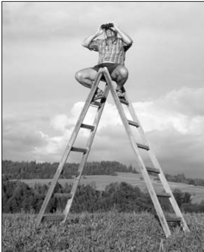
Rozhledna na bukovické homoli (ať i trochu do Silvestra)

Z toho venku nejsme ani doma. Pan Ráth - nebo jeho soudce - mají ještě pořád rýmu a už tu máme další kauzy, některé se týkají i kraje olomouckého. Případy, které zase nikdo nedořeší, případy, které jen penězi z našich daní živí dlouhé zástupy právníků a soudců, z nichž většina slouží té či oné straně k úspěšnému kopání pod koberec a výsledný dojem pro člověka prostého je nadále také prostý - je to trvalý, rozkvětu nesloužící, boj o koryta.