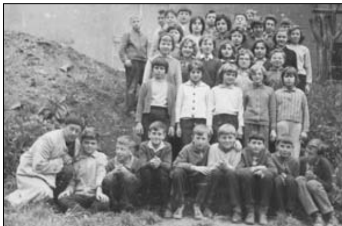
Děti s p. farářem na školním dvoře - červen 1965