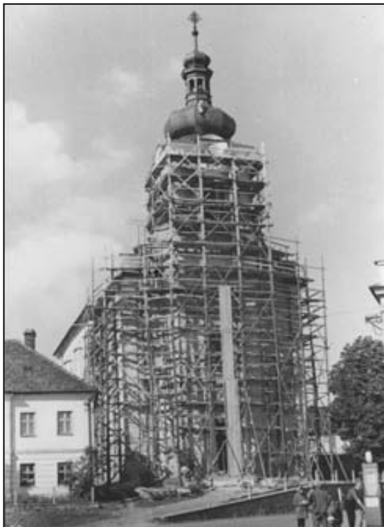
Kostel před opravou - srpen 1966